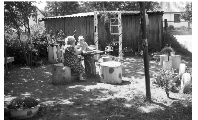
Детская площадка на улице Новая.

Изумительное зрелище ожидало меня возле дома семьи Цуркан. Людмила и Валентин – молодые, не местные. Часть дома они купили под дачу. И приезжают сюда на